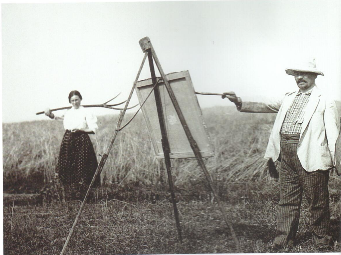
KOSZTA JÓZSEF Annuskát festi 1915 körül

éppen ilyen könnyedséggel kezeli épp aktuális, legfontosabbnak tartott művei listáját is. Koszta József szinte alig írt, még baráti hangú levelekből is csak igen kevés maradt fenn, azok is inkább a vele mély közösséget érző és vállaló Rudnay Gyulához szóltak. Nem is lehet véletlen, hogy 1948-ban, nem sokkal a festő halála előtt, Ybl Ervin egy hosszú, faggatózó hangnemű levélben fordult Koszta-hoz azért, mert a művészeti lexikonok, egyéb kiadványok is csak „címszavakban” tudtak információt szolgál-