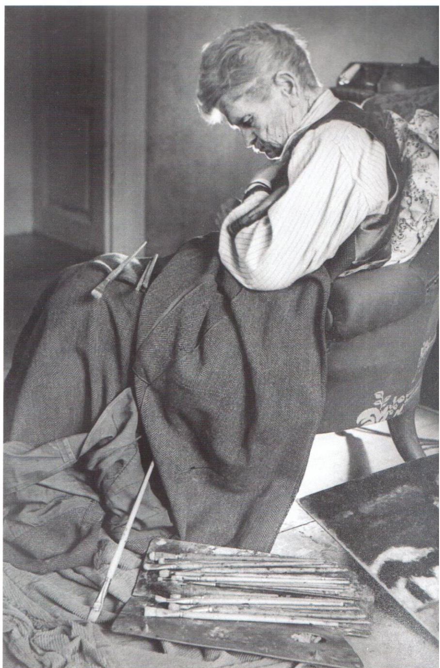
Az utolsó kép, 1948

A tanulmány második felében Szinyei Merse Anna alapos elemzés alá veszi Koszta József életművét minden korszakát, és a források összevetésével, a képek szemléltető jellegű leírásával vázolja fel művészetének lényegi elemeit. Nagyon fontos, hogy a művek reprodukciói egységesen és jó ritmusban illeszkednek a szöveghez, megkerülhetetlen „kontrollanyagot” nyújtva a leíráshoz. A korabeli források alapos ismerete adja a bátorságot az elemzőnek ahhoz, hogy többször is megemlítsen, Koszta különös hangulatú, egyéni festészete bizonyára nem alakulhatott volna ki ilyen formában, ha nincs meg benne a világgal sokszor konfliktusba kerülő, alapvetően visszahúzódó természet. Ennek következménye, hogy Koszta egyedi, önálló